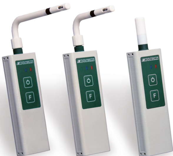
FH 1746-1C2VR2 FH 1746-1C2VR1 FH 1746-1C4 / HT