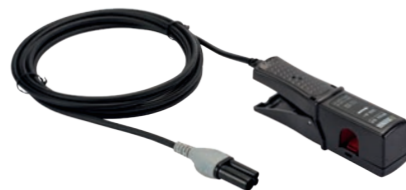
ZANGENSTROMWANDLER MINI 94

Der Zangenstromwandler Mini94 ermöglicht die Messung von Wechselstrom von 50 mA bis 200 A ohne Eingriff in die Anlagen (keine Unterbrechung des zu messenden Stroms). Aufgrund seiner hervorragenden Genauigkeit (Verstärkung und Phasenverschiebung/Genauigkeitsklasse 0,2) eignet er sich besonders für Strommessungen mit Leistungs- und Energieanalysatoren. Er kann unter anderem zur Überprüfung von Energiezählern herangezogen werden.